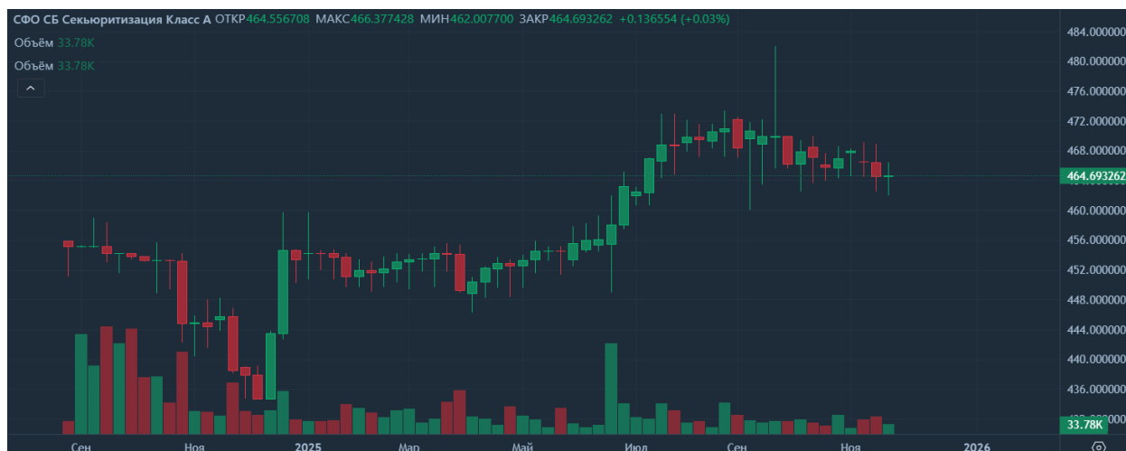
Рисунок 3. Динамика котировок на секьюритизированную облигацию Сбербанка

Последним ярким примером на отечественном рынке являются облигации Сбербанка [3]. Они также обеспечены залоговым обеспечением, как и в случае с ВТБ. Для выпуска таких облигаций была создана специальная финансовая организация СБ Секьюритизация. Текущая цена на облигацию равна 464,69 рублей, по облигации выплачивается ежемесячный фиксированный купон в размере 17,63%, датой погашения объявлено 26 августа 2033 года.